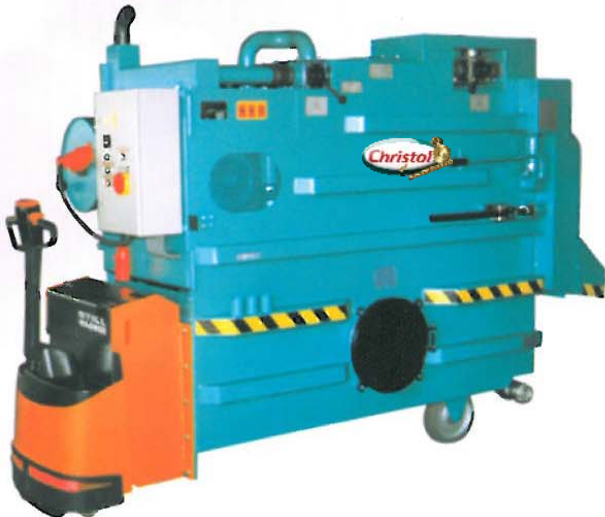
Großsaugwagen mit Schlamm- abteil und Fahrtrieb